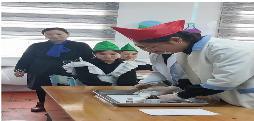
1- Окуучулар жер семиртичтерди аныктап жаткан учуру.

Үчүнчү багыт. Рефераттарды жана текшерүү иштерин аяктоо процессин камтыйт, окуучулар менен мугалимдер ар кандай класстан тышкаркы иш-чараларын өткөрүшөт. Медициналык окуу жайга тапшырам деген окуучулар менен тыгыз байланышта болот, олимпиадаларга, ыктыярдуу тесттерге катышышат. Аймактагы алдыңкы мугалимдердин эмгегин баса белгилеп кетишет. Ар кандай иш-аракеттерди өз алдынча иштеп чыгуу («Ийрим класстарында түшүнүктөрдү калыптандыруу, чөкмө жана бөлүү хроматографиясы», «Алхимиядан өткөндөн бүгүнкү химияга») ж.б. Тезистер химия клубунун программасын иштеп чыгууну жана анын натыйжалуулугун, ал боюнча методикалык сунуштар жана алардын мектепте болушу («Окуучулардын методдору менен таанышуусу үчүн ийрим заттарды изилдөө», «Органикалык химия боюнча ийримдик сабактардын мазмуну», «Айылдык мектептеги мектептин химия кабинетинин жабдылышы» (1-сүрөт, Аң-Өстөн орто мектебинин химия мугалиминин тажрыйбасынан)» жана башкалар.